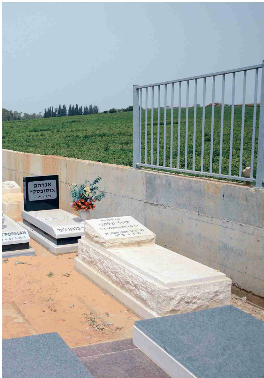
בית העלמין בהוד השרון, "זכותו של אדם להיקבר לפי אמונתו ושללת מתושבי העיר"

החוק מחייב את הרשויות המקומיות להקצות שטח לקבורה אורחית, אולם אף אחת מהן אינה עושה זאת. בהוד השרון, העירייה ורשות מקרקעי ישראל כבר זורקות את האחריות זו על זו / שלומית צור