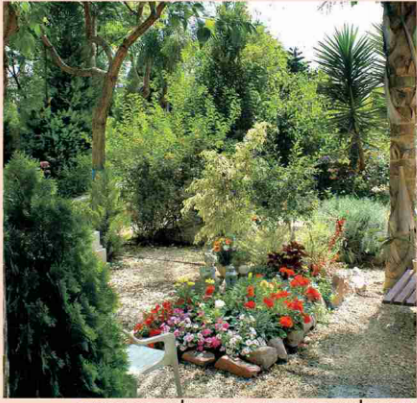
בית העלמין בקיבוץ עינת. המדינה לא הקצתה שטח

על רקע התגברות הצורך במקומות קבורה לעולים מברית המועצות שיהדותם היתה מוטלת בספק, נחקק באותה שנה לראשונה חוק הקובע כי צריכה להיות אלטרנטיבה של קבורה אזרחית בבתי עלמין בישראל, אך החוק לא קבע כיצד תוקצה הקרקע למטרה זו.